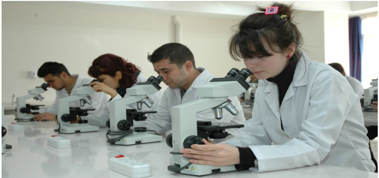
Eğitim Afyon Kocatepe Üniversitesinde alınır...